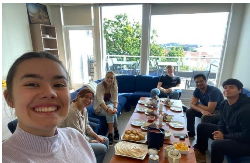
Afscheidslunch YWAM Kristiansand