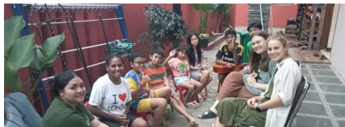
Sharing time met enkele Kings Kids

Enkele dagen voor het evenement in Kristiansand kwam mijn visa binnen, dus God wilde me denk ik nog even in Noorwegen gebruiken. De reis verliep eigenlijk heel soepel. Ik ervoer wonderbaarlijke rust en Gods woorden uit Jes 41:10 bleven in mijn hoofd ronddwalen.