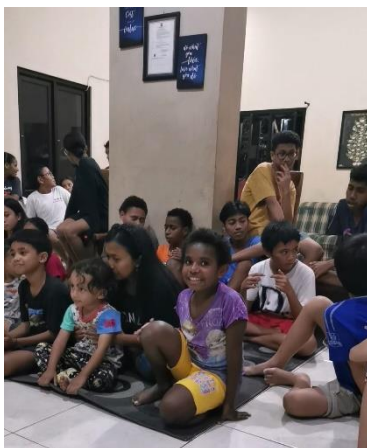
Enkele Kings Kids in ABBA Kings Kids huis