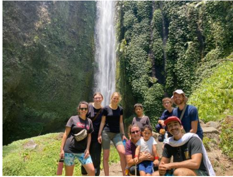
Naar waterval vlakbij Malang met een team uit Australië.