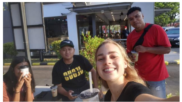
Met staff van ABBA